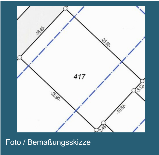
Foto / Bemaßungsskizze