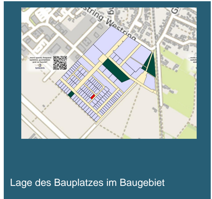
Lage des Bauplatzes im Baugebiet