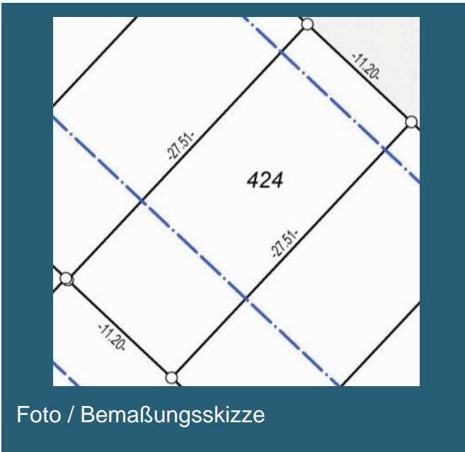
Foto / Bemaßungsskizze