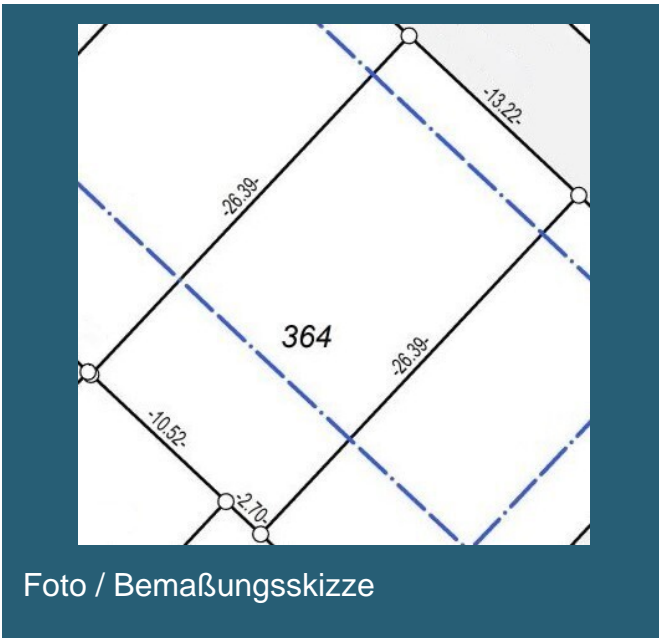
Foto / Bemaßungsskizze