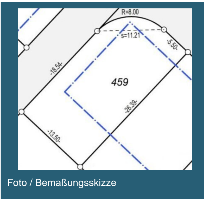
Foto / Bemaßungsskizze