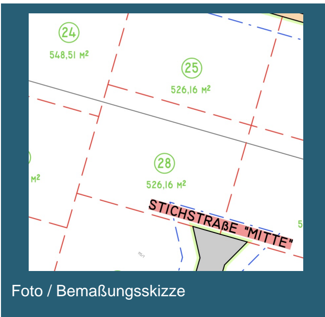
Foto / Bemaßungsskizze