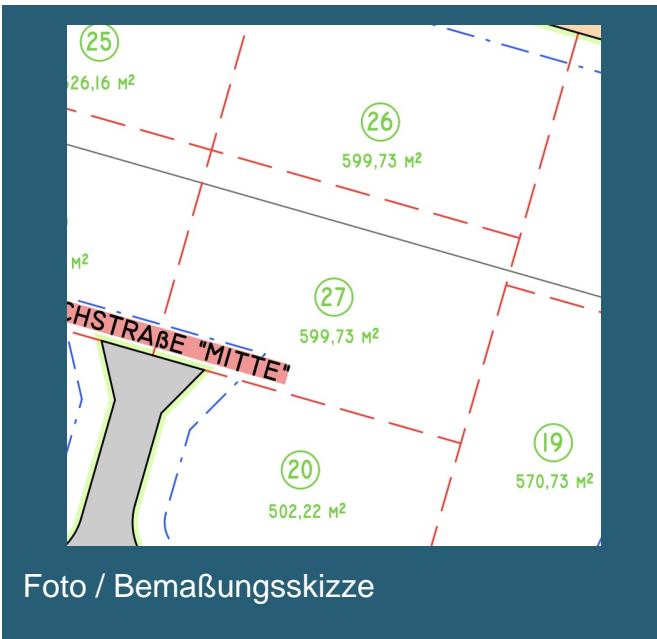
Foto / Bemaßungsskizze