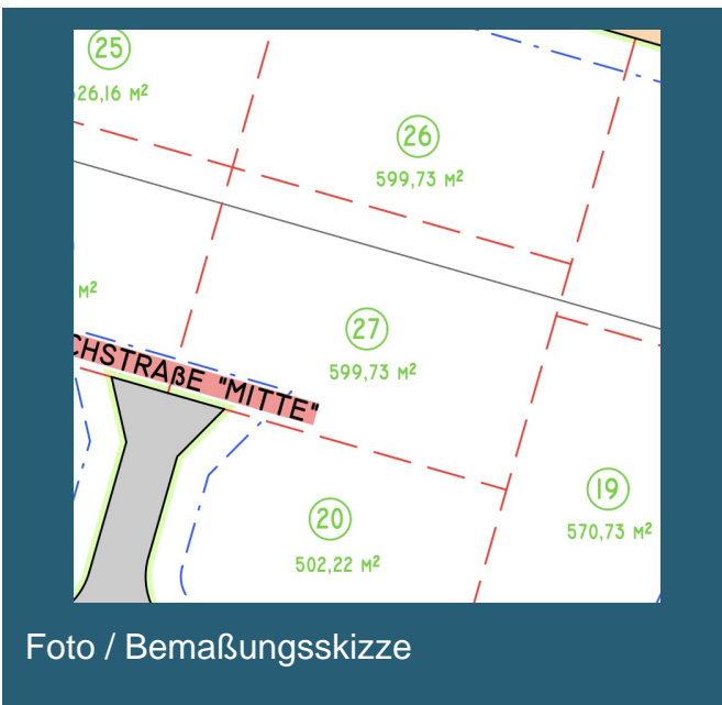
Foto / Bemaßungsskizze