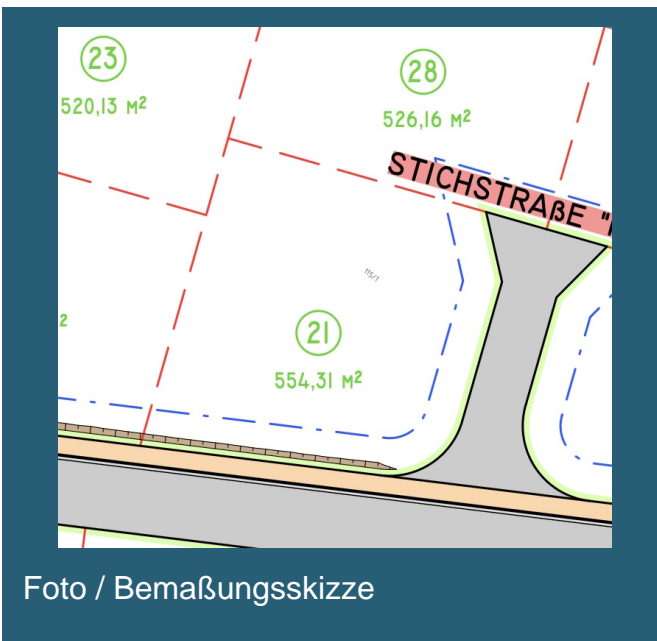
Foto / Bemaßungsskizze