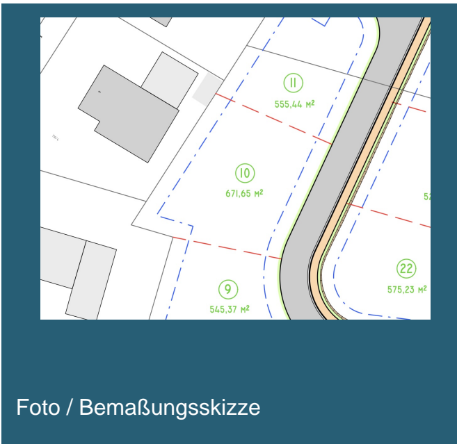
Foto / Bemaßungsskizze