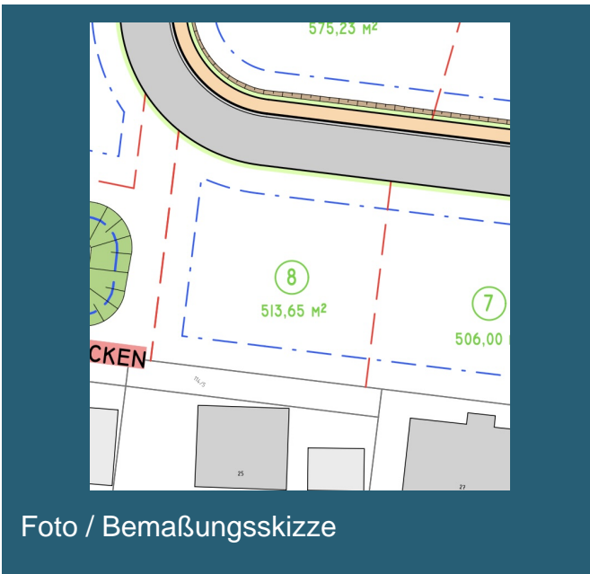
Foto / Bemaßungsskizze