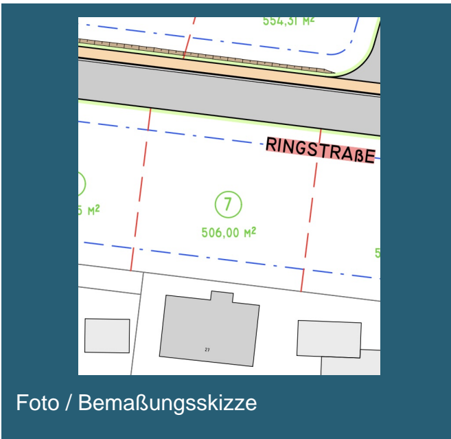
Foto / Bemaßungsskizze