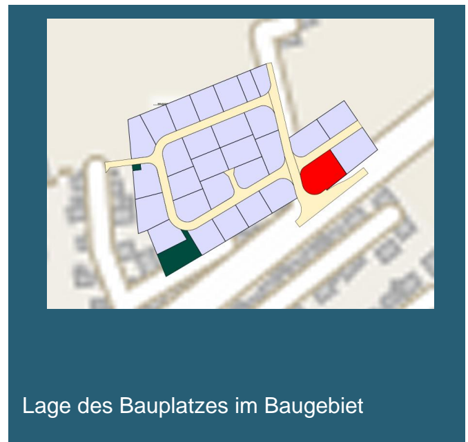
Lage des Bauplatzes im Baugebiet