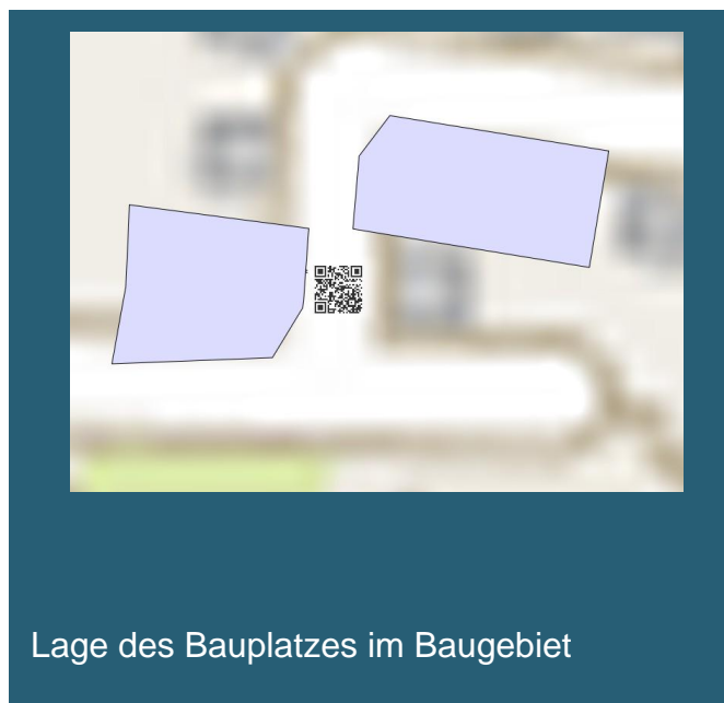
Lage des Bauplatzes im Baugebiet