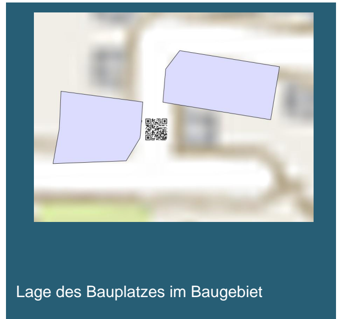
Lage des Bauplatzes im Baugebiet