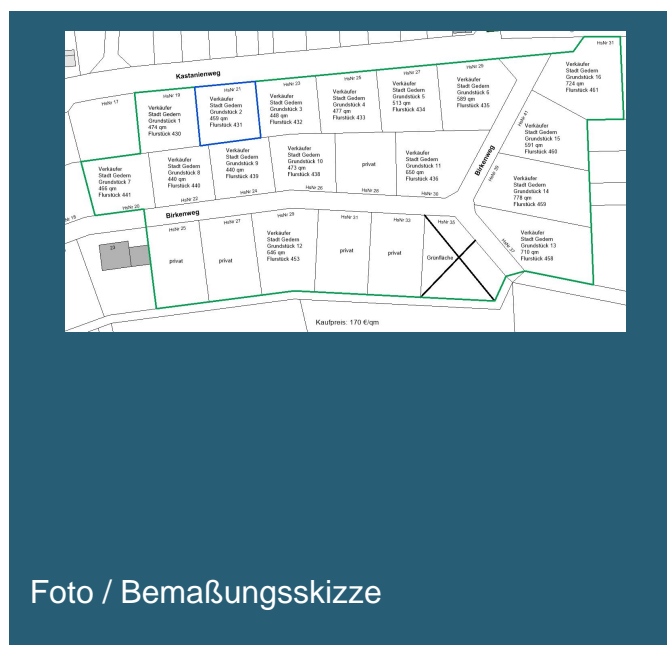
Foto / Bemaßungsskizze