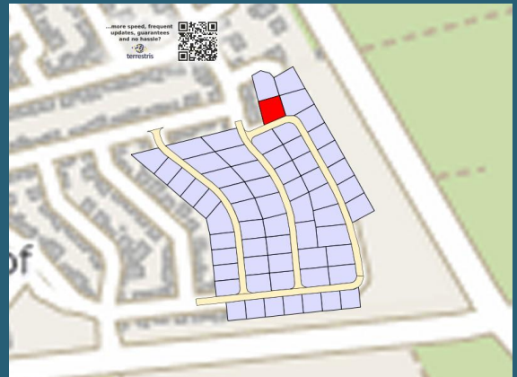
Lage des Bauplatzes im Baugebiet