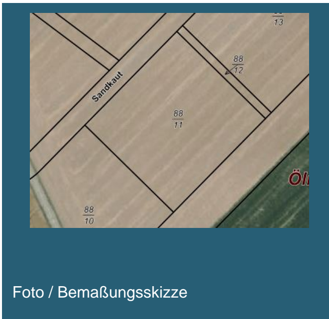
Foto / Bemaßungsskizze