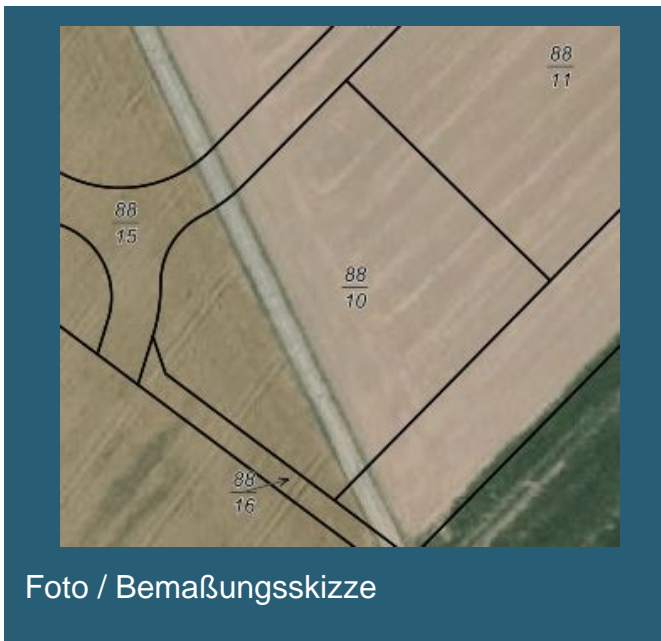
Foto / Bemaßungsskizze