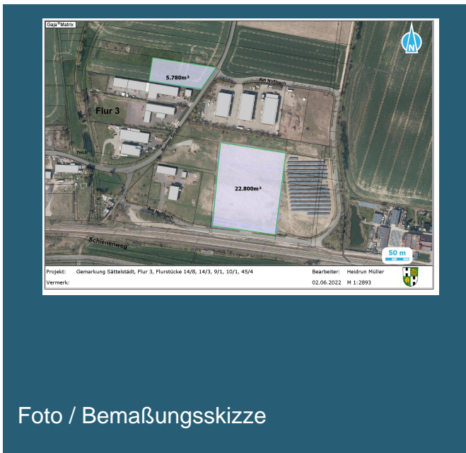
Foto / Bemaßungsskizze