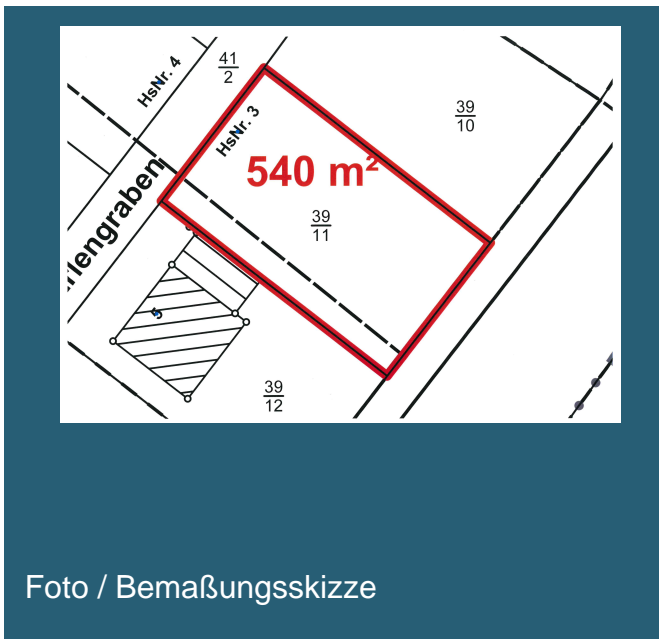
Foto / Bemaßungsskizze

ohne Erschließungskosten für Wasserversorgung und Abwasserentsorgung