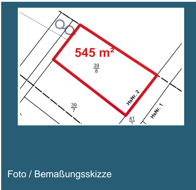
Foto / Bemaßungsskizze

ohne Erschließungskosten für Wasserversorgung und Abwasserentsorgung