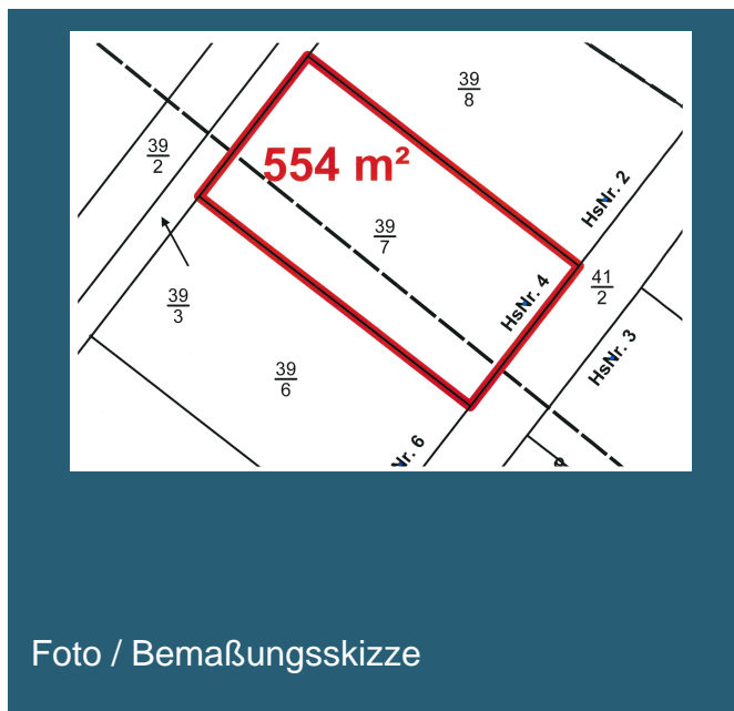
Foto / Bemaßungsskizze

ohne Erschließungskosten für Wasserversorgung und Abwasserentsorgung