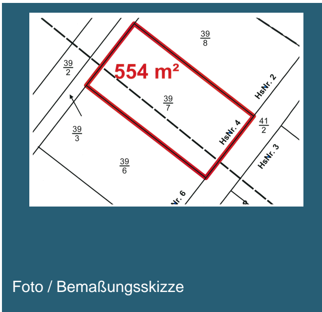
Foto / Bemaßungsskizze

ohne Erschließungskosten für Wasserversorgung und Abwasserentsorgung