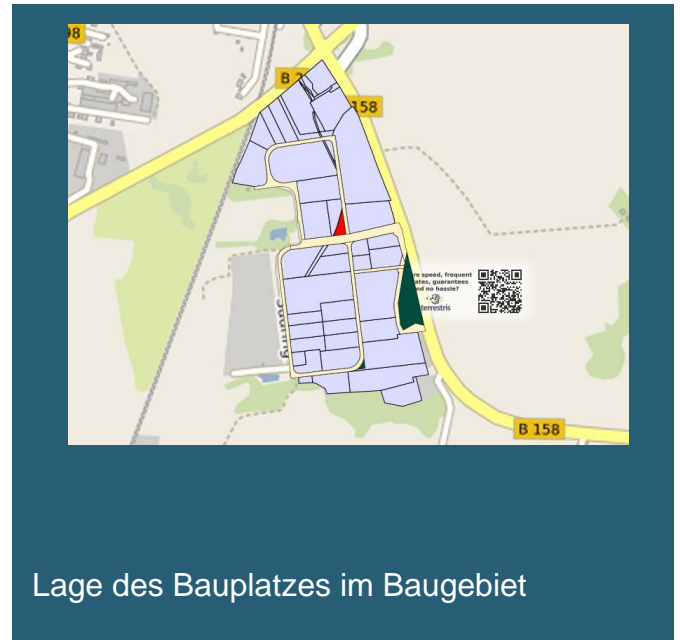
Lage des Bauplatzes im Baugebiet