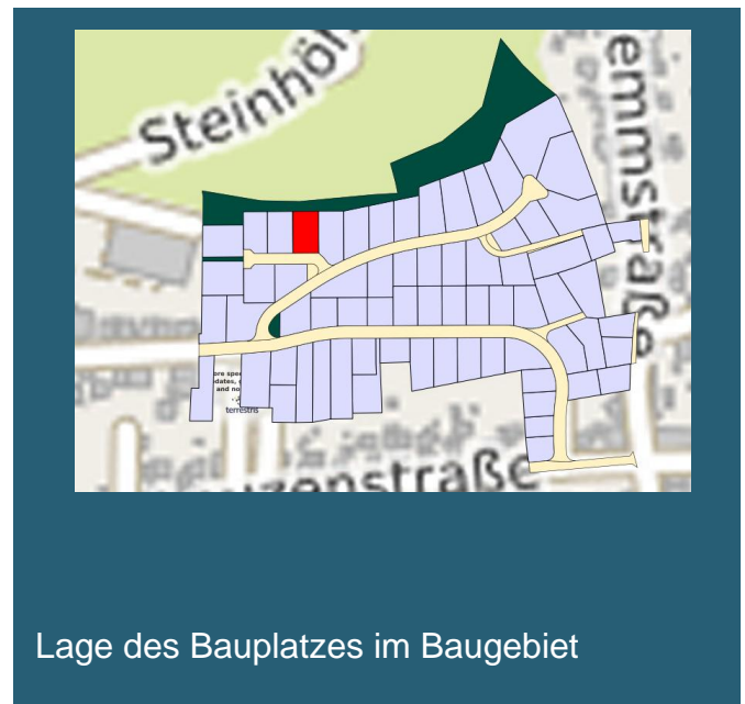
Lage des Bauplatzes im Baugebiet