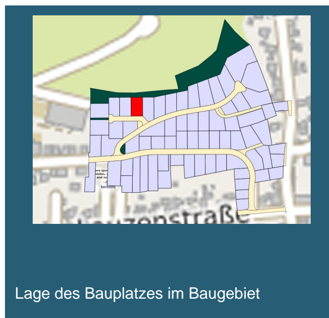
Lage des Bauplatzes im Baugebiet