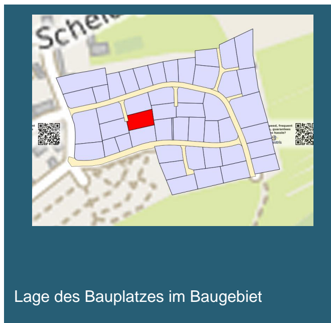
Lage des Bauplatzes im Baugebiet