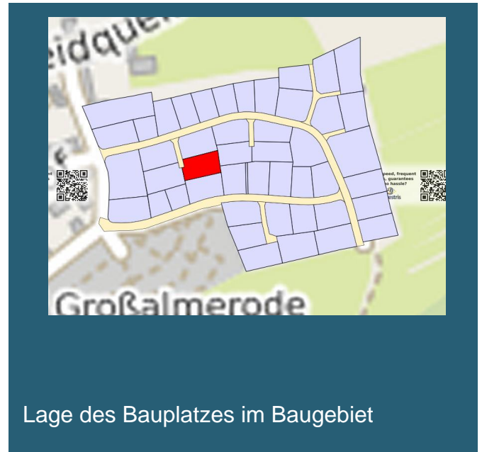
Lage des Bauplatzes im Baugebiet