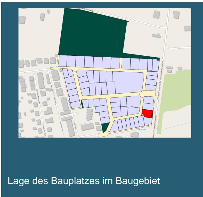
Lage des Bauplatzes im Baugebiet