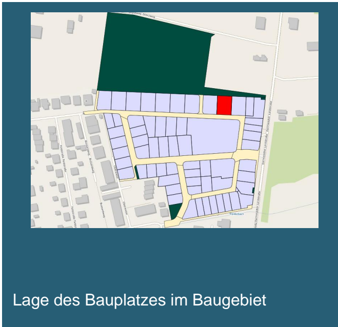
Lage des Bauplatzes im Baugebiet