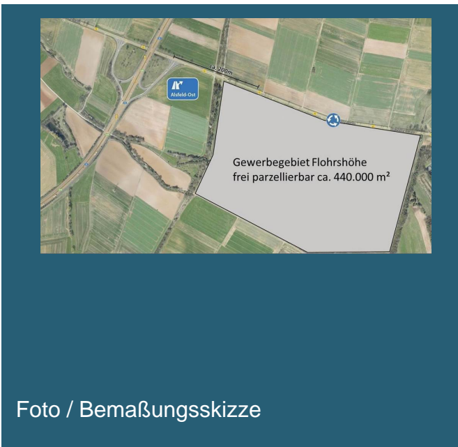
Foto / Bemaßungsskizze